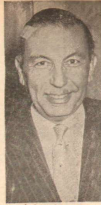
İ. Sabri Çağlayangil Sür'atli fikir değişikliği

Toplantı Çalışma Bakanının ve mensup bulunduğu Hükmetin, çok çabuk fikir değiştirdiğini ortaya çıkmasına vesile oldu. İşçiler uzun süredir sosyal mesken alanlarına getirilen tahdidin kaldırılması çabası içindeydiler. Alan tahdidi üzerine, işçilerin sigortadan mesken kredisi talepleri durmuştu. Mesele, işçi — Bakanlar toplantısına getirilmiş, Çalışma Bakanı bu tahdidin kaldırılacağını söylemişti. Çağlayangil, bütçe müzakerelerinde de bu görüşü ifade