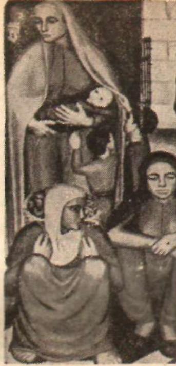
Balaban'ın bir tablosundan «Sanat akıllı işidir»

Delilerin yaptığı resimleri, uslu ların resmidir diye ortaya sürmele toptan ayıp, rezale' ve de göz boyacıdır. Benim sergimin yanında, Antalya'da, delilerin de sergisi vardı. Sordum, bir delinin önüne, eline usturayı verip olmak