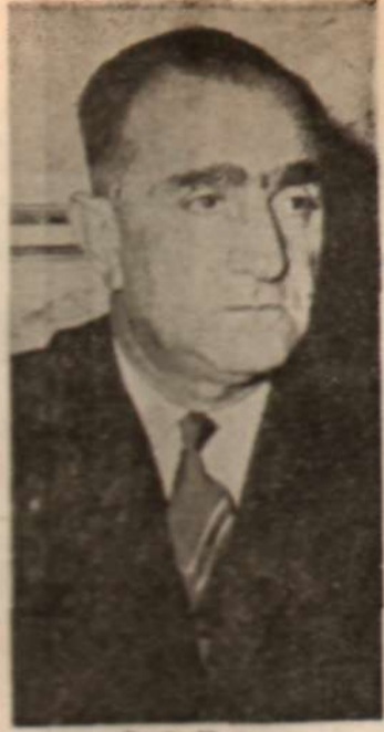
Daniş Koper «Çekilmedi»

cerayan etmesinde yaramaktan başka bir fayda sağlamıyor. Geçen hafta içinde yapılan bir komisyon toplantısında, CHP'nin eski Tarım Bakanı İsmail Şahin'in ısrarı istogüne rağmen çekilme kararının konuşulmasına imkân vermeyen Cavit Oral, kendisine söz verip Toprak Reformu konusunda «gomonistlerin taktiği» ni anlatmaya koyulmuştur. Cavit Oral'a göre, Türkiye'de toprak reformu isteyenlerle Sovyetler Birliği'nde ihtilali yapılar arasında muazzam bir benzerlik vardır. Toprak ağalarının kötüleme gayretli, Rusya'da «kulak» lara karşı açılan mücadeleyle tam bir paralellik içinde. İzlenecek metod da oradaki aynıdır: Önce topraklar parçalanacak, sonra kooperatifleştirilecek, ondan sonra da kolektifleştirilecektir. Böylece üçü bir safhalandırmaya olsa olsa Lenin'in metodlarını Türkiye'de de uygulamaktan başka bir şey olamaz!