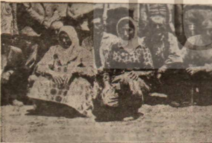
Adana'daki üzücü olayda tevkif edilen köylüler

Toprak Reformu Kanunu tasarısı, Başkanlığına büyük toprak sahibi Cavit Oral'ın yaptığı bir Komisyon'da çok eğlenceli sahneler